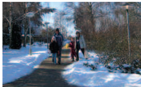
Sidste års indsamling foregik i det smukkeste (kolde!) vintervejr, så der blev drukket godt med varm cacao efter turen.