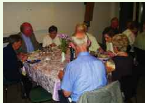
Fotos: Besøgstjenestens generalforsamling.